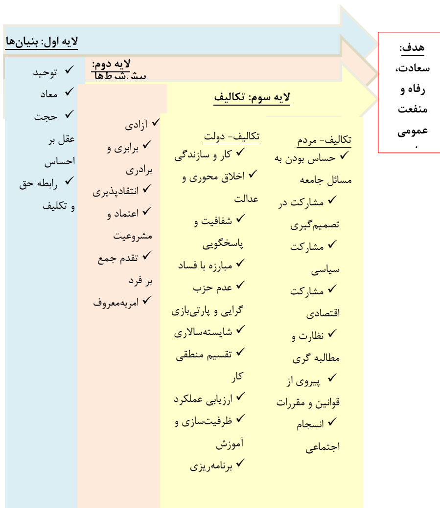
شکل ۱. الگوی مفهومی مشارکت دولت و مردم از دیدگاه نهج البلاغه